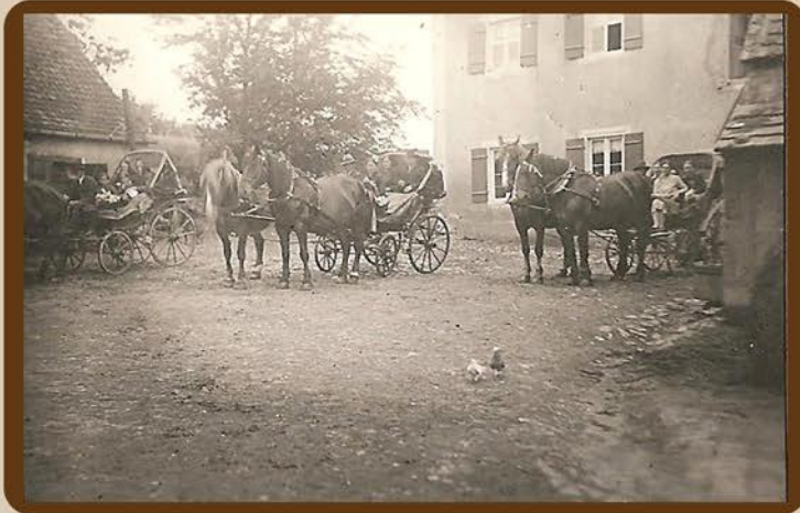
Hochzeitskutschen, die Taxis der damaligen Zeit.