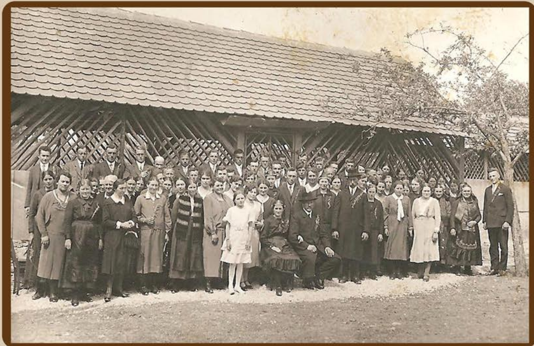
Hochzeitgesellschaft, hinter dem Brautpaar meine Eltern. Einige Frauen tragen Rieser Feiertags-Tracht.